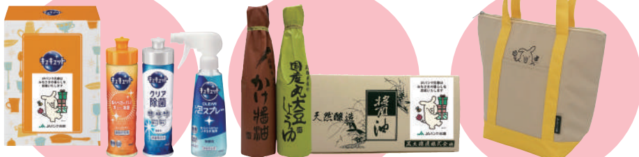
花王「キュキュットセット」