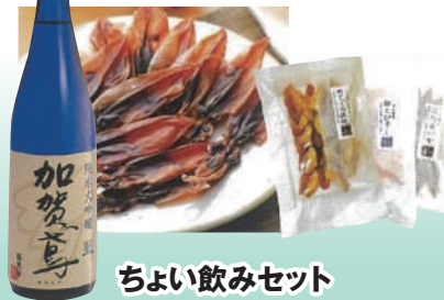
ちよい飲みセット