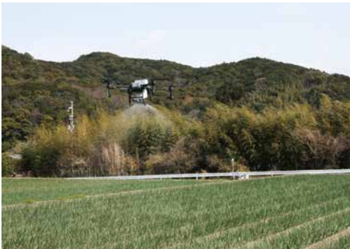
玉葱の施肥を行う農業用ドローン

施肥は、規定量を短時間に均一に施用することが可能であり、また、防除は空中散布に登録のある薬剤のみの散布となりましたが、短時間での施肥・防除が可能となりました。今後は生育・病害状況を慣行区と比較しながら適応性について検証を行います。