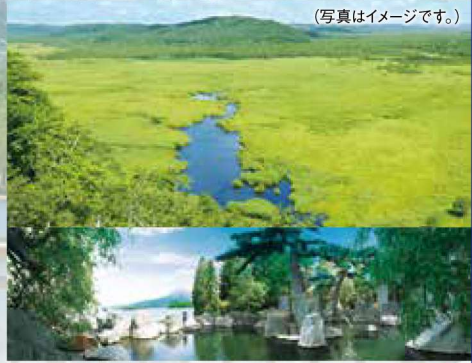
(写真はイメージです。)

※詳しい旅行条件を説明した書面をお渡ししますので事前にご確認の上、お申し込みください。