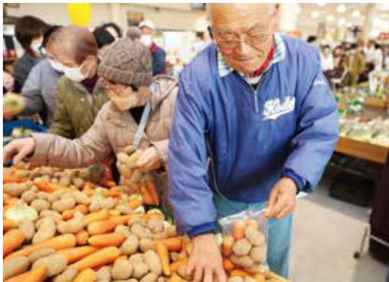
新鮮野菜を詰め放題

3月21日、農畜水産物直売所・美菜恋来屋ではオープンから9周年を記念し、日頃から利用していただいている方へ感謝を込めた『9周年感謝イベント』を開催。平日にもかかわらず大勢の方々が来店しました。特に人気を集めた「野菜詰め放題イベント」に参加した女性は、「普段から来ているが、イベントに参加するのは初めて。詰めるのも楽しくお得で嬉しい。これからもどんどんイベントを開催してほしい」と買い物を楽しんでいました。